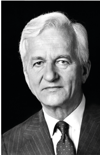
„Und dennoch wurde von Tag zu Tag klarer, was es heute für uns alle gemeinsam zu sagen gilt: Der 8. Mai war ein Tag der Befreiung.“ (Richard von Weizsäcker, ehemaliger Bundespräsident, in seiner Rede am 08. Mai 1985)

Gedanke durchgesetzt wurde, bedurfte es, denke ich, auch eines Generationenwechsels. Das wird vielleicht zu häufig vergessen, dass auch die unmittelbare Generation der Täterinnen und Täter aus den Ämtern sukzessive verschwinden musste, dass sich da tatsächlich etwas drehen konnte.