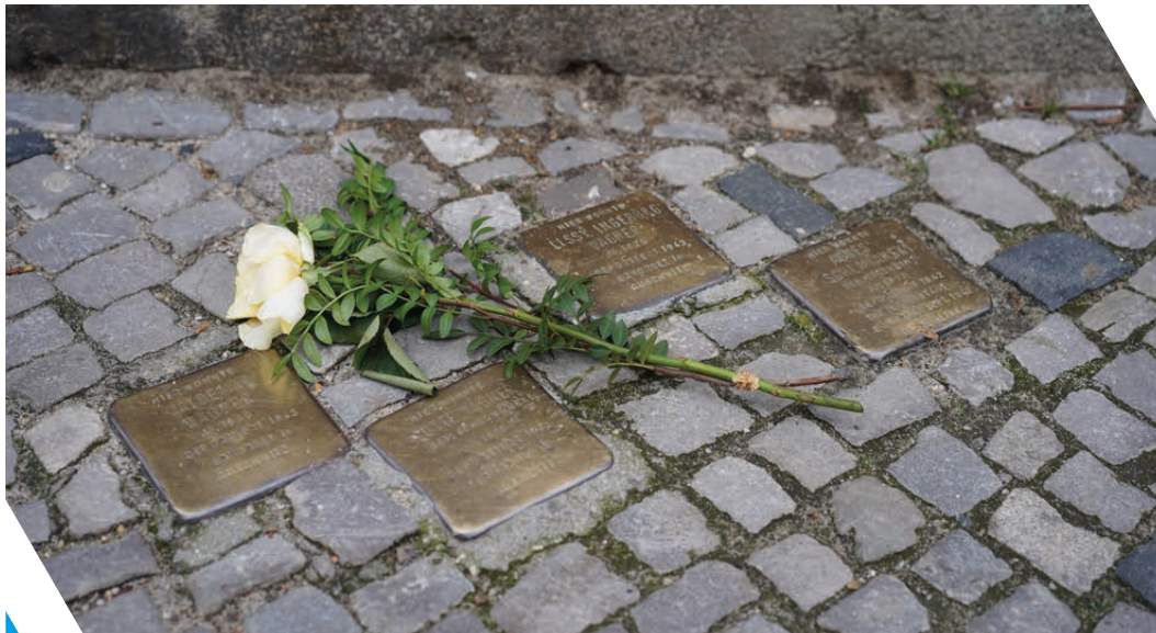
Stolpersteine in Erinnerung an die Opfer des Nationalsozialismus