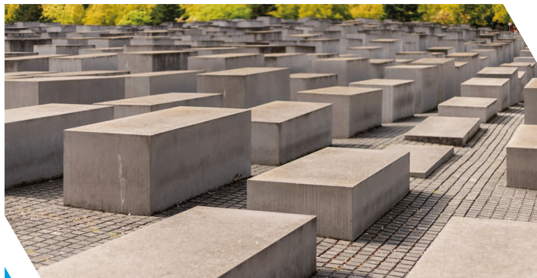
Das Holocaustmahnmal in Berlin, vom AfD-Politiker Björn Höcke 2017 ablehnend als „Denkmal der Schande“ bezeichnet

Man sei, so heißt es dann, schließlich nicht schuld an dem, was damals geschah. Tatsächlich geht es heute aber weniger um Schuld als um die Verantwortung, im Wissen um die Vergangenheit im Hier und Jetzt dafür Sorge zu tragen, dass reaktionäre bzw. faschistische Massenbewegungen nicht erneut die Macht erlangen, mittels derer sie ihre Opfer drangsalieren und schlimmstenfalls töten können. Zu betonen ist, dass die Erinnerungsabwehr keineswegs nur ein Anliegen der extremen Rechten ist. Stattdessen ist die Forderung nach einem Schlussstrich unter die deutsche Vergangenheit nach