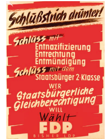
Erinnerungsabwehr und Schlussstrichforderung, 1949

Wir sehen also auf der einen Seite in der sogenannten Bewältigung der deutschen Vergangenheit durchaus sehr früh, in einigen kleinen Teilbereichen, auch in offiziellen Reden, beispielsweise auch von Theodor Heuss, den Gedanken der Befreiung. Bis sich das aber generell gesamtgesellschaftlich durchsetzt, dauerte es im Prinzip bis zu Weizsäcker. Es gab immer wieder, man könnte sagen: Wegmarken, die gesetzt wurden. Auch Helmut Schmidt hatte das schon gesagt. Helmut Kohl hat das kurz vor Richard von Weizsäcker auch schon geäußert. Wie gesagt, der Bogen ging über einige Jahrzehnte, aber bis dieser