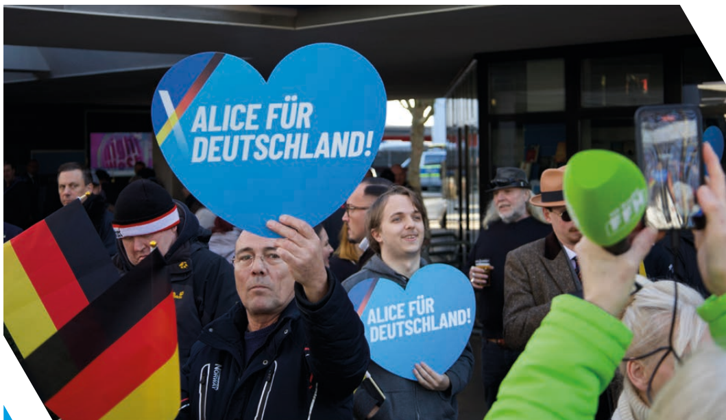
Wahlkampf der Alternative für Deutschland (AfD), 2025

Es geht mir noch mal um den Umgang mit dem NS durch die AfD. Das Bemerkenswerte an der Positionierung der AfD zum Nationalsozialismus ist eine gewisse Doppelstrategie. Auf der einen Seite man lehnt die Beschäftigung ab. Man möchte eben keine Aufarbeitung der Vergangenheit. Das wird dann positiv formuliert. Das kennen wir aber auch schon aus dem Jargon der alten NPD. Man wolle sich ja der Zukunft widmen und nicht der Vergangenheit. Das ist ein Klassiker, der in die Rhetorik eines jeden rechten Agitators gehört. Auch Björn Höcke sagt so etwas gerne. Gleichzeitig versteht man sich aber sehr genau auf die Provokation. Man kokettiert regelrecht mit bestimmten Motiven. Denken wir an die Auseinandersetzung um die von Björn Höcke verwendete Parole der SA, der nationalsozialistischen Sturmabteilung, „Alles für Deutschland“. Das wurde dann übernommen im Bundestagswahlkampf. Durch eine ganz leichte phonetische Verschiebung wurde daraus „Alice für Deutschland“ gemacht. Das war natürlich ein Kokettieren. Man hatte eine juristische Auseinandersetzung, man hatte große Probleme, geht dann aber in die Offensive, indem man diese Parole auf Alice Weidel, die Spitzenkandidatin der AfD, gewissermaßen umschneidert und dann natürlich sich wieder völlig unschuldig geriert und darin überhaupt nichts Verhängliches sehen kann.